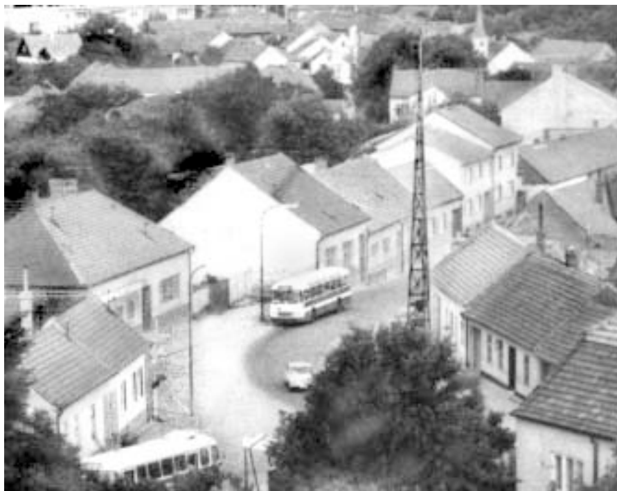
Dejlovka ještě na původním místě.