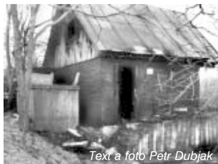
Text a foto Petr Dubjak

V pátek 8. března ve večerních hodinách se v obci roznesla fáma, že nad Ostopovicemi hoří les. Z mnoha míst byly vidět mezi stromy plameny. Obětí se však stala chata těsně za vrcholem Přední hory. Díky všem, kdo volal na 150 a tím pomohli zachránit okolí požáru.