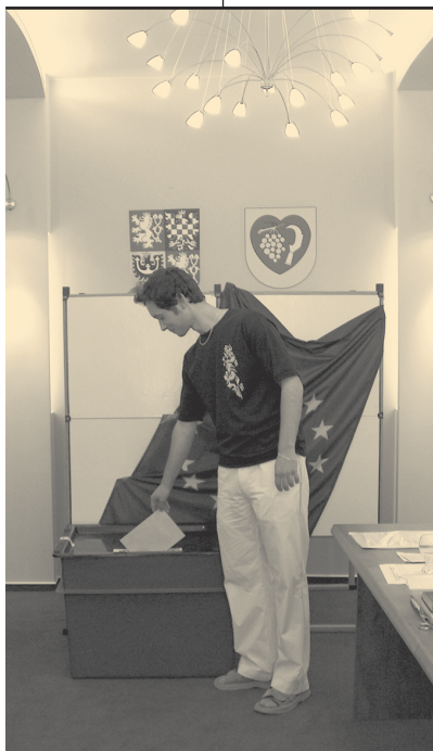
Výsledky voleb do Evropského parlamentu probíhající v Ostopovicích ve dnech 11. – 12. června 2004.

V naší obci se voleb zúčastnilo 431 občanů, tj. 39,5 % oprávněných voličů.