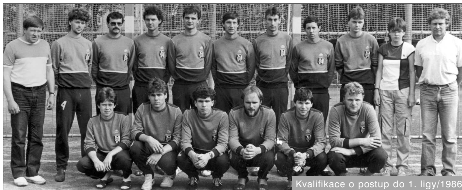
Kvalifikace o postup do 1. ligy/1986