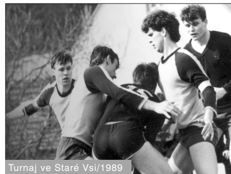
Turnaj ve Staré Vsi/1989