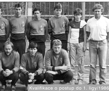
Kvalifikace o postup do 1. ligy/1986

nou doma posilování, případně v Bosonohách herní situace. Muži zajišťují trénovat do haly na Moravskou Slávií.