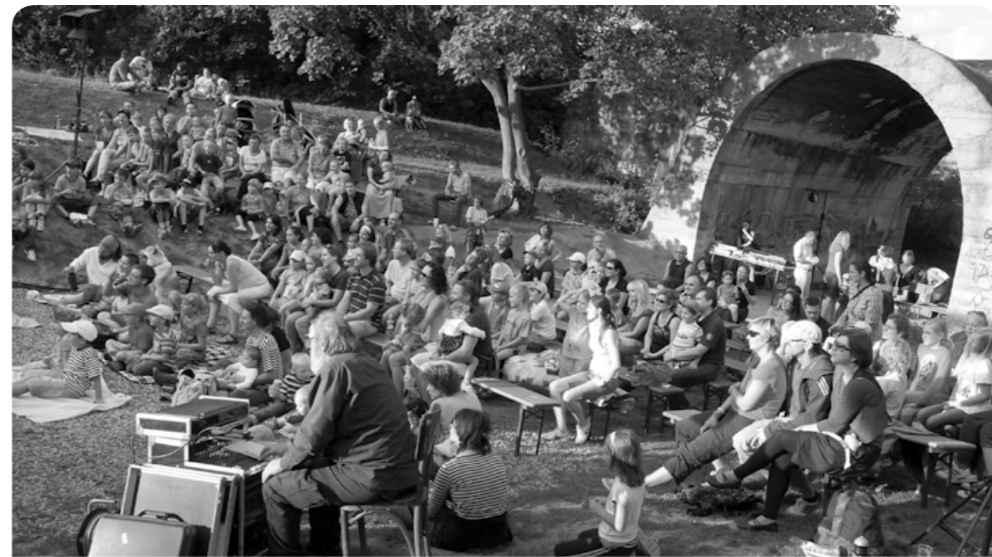
Divadelně-hudební festival Husa na dálnici - 2012