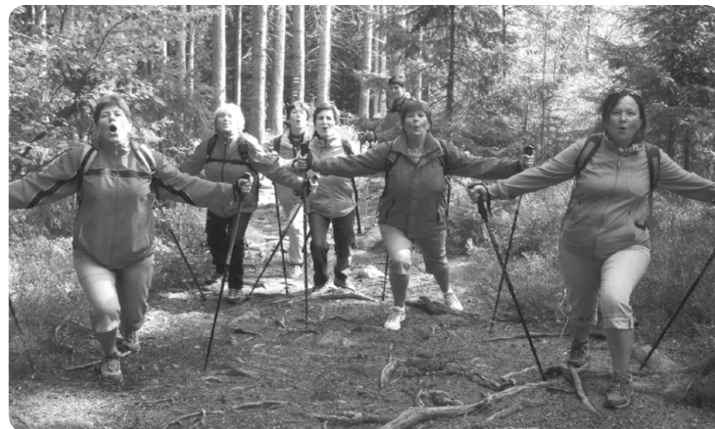
důchodci v akci - náročný pochod s nordickými hůlkami