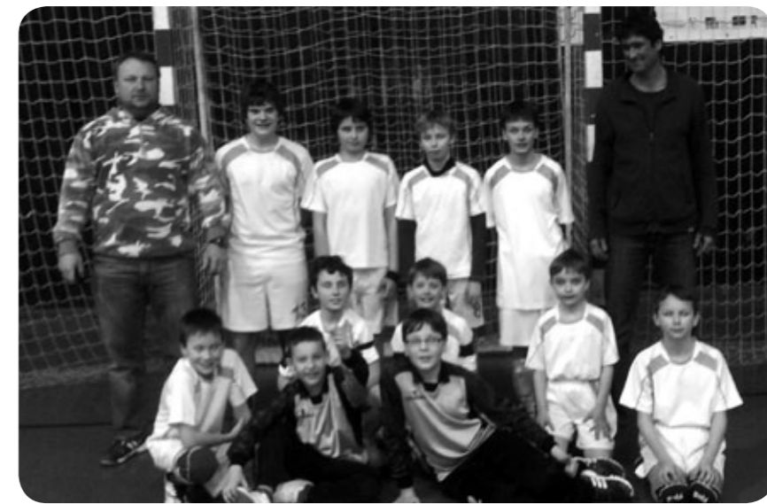
stříbrní ml. žáci z finále zimního poháru ČR v Plzni