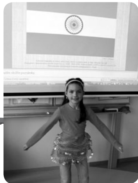
Indie v Ostopovicích, autoři: učitelé MŠ a ZŠ Ostopovice