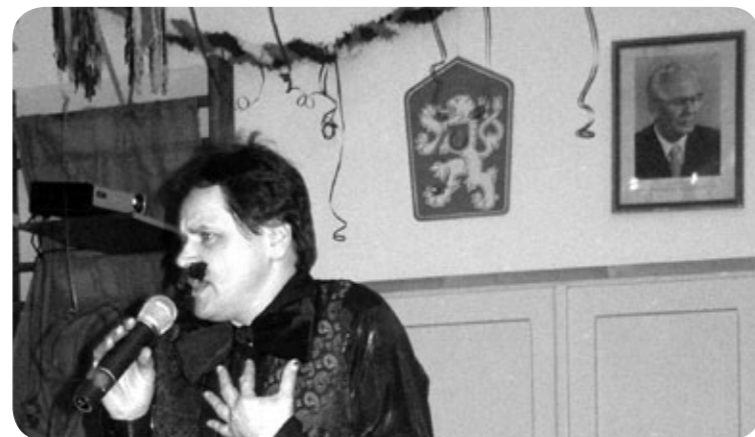
poutavý výstup na Retroplese