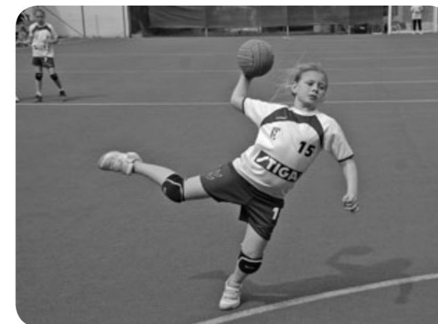
mladší žačky v akci