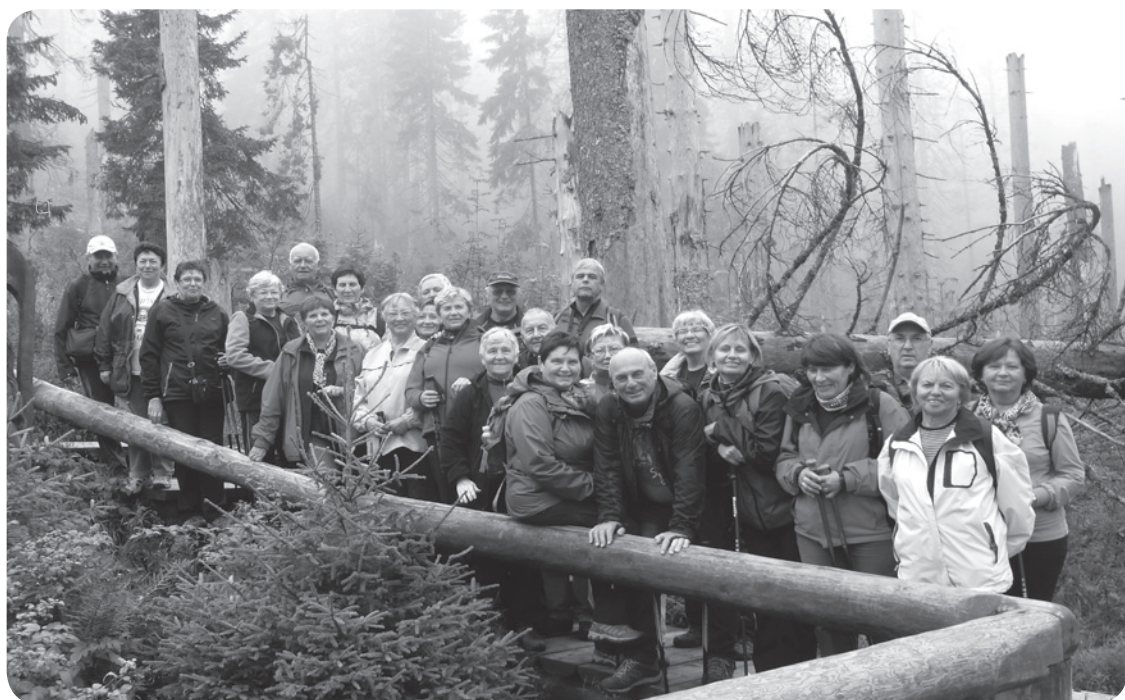
Senioři na Šumavě (čtete na straně 14)