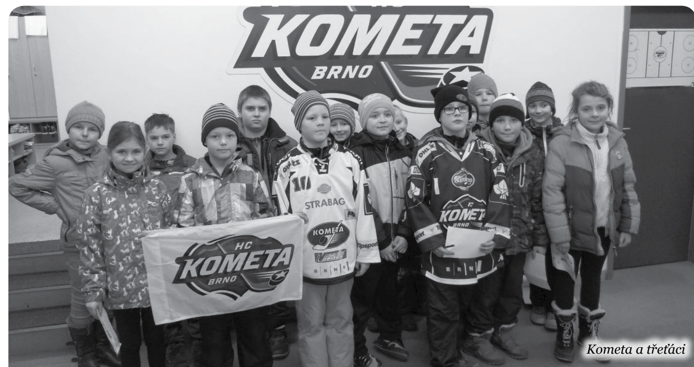
Kometa a třetáci