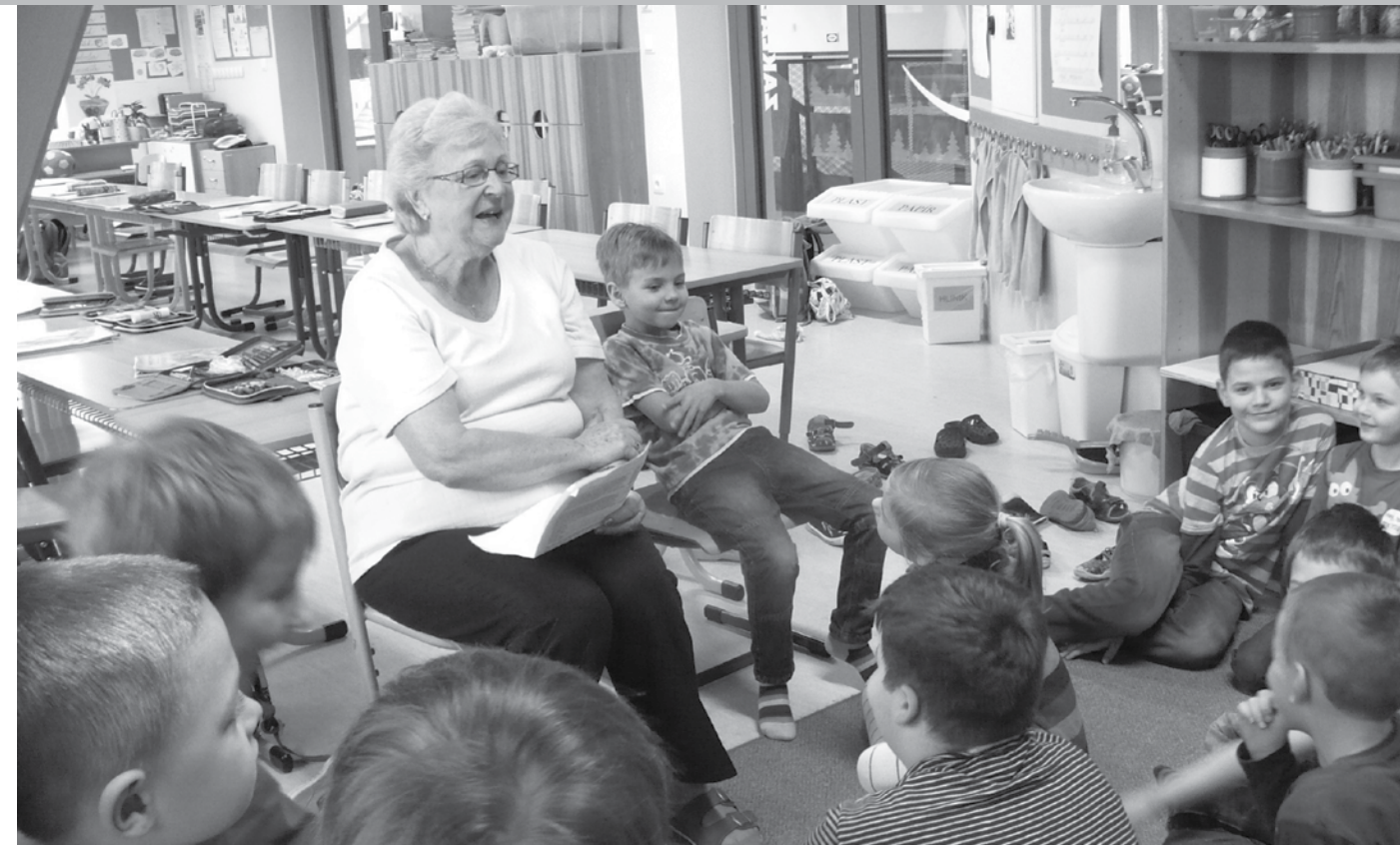
Děti a učitelky mateřské školy

I tradiční maškarní karneval se nesl v duchu multikultury. V průběhu karnevalu jsme střídali z luku a házeli lasem jako indiáni, bubnovali s černoškou, lovili ryby s Eskymákem, jedli hůlkami s Japonkou a krotili býka ve Španělsku. Krásnou tečkou za naším cestováním byla návštěva hvězdárny, kde jsme se podívali i mimo planetu Zemi. Teď už se těšíme na další jarní akce (burza 16. 3., velikonocní dílny 23. 3. a jarní tvoření při oslavách Dne Země 22. 4.).