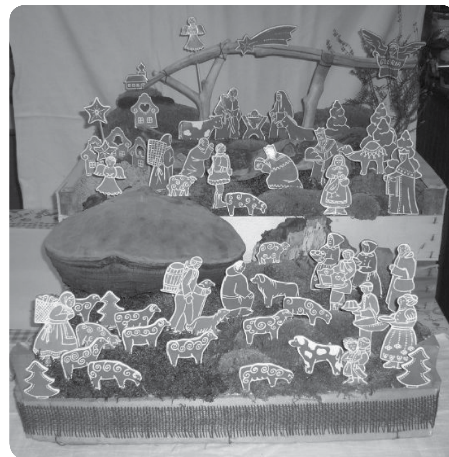
betlém z terakoty