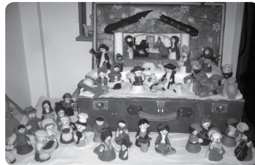
betlém z rouna