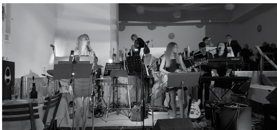
obecní ples, Blue Bench