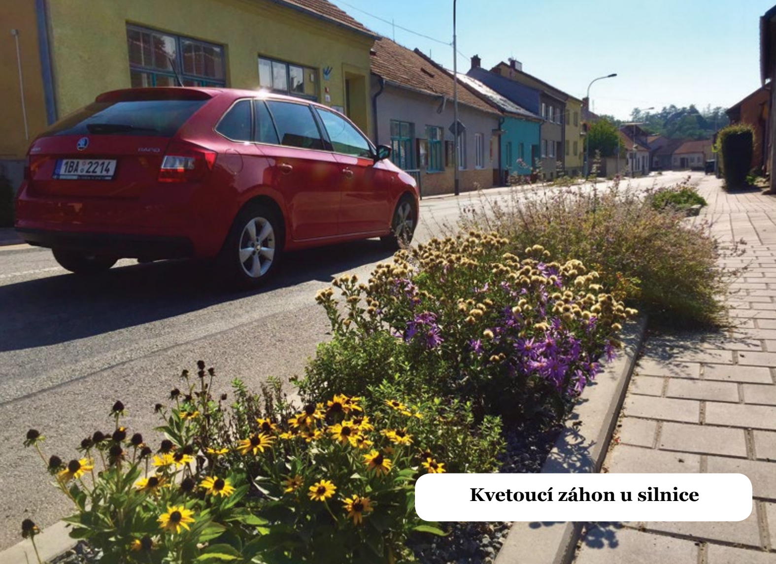
Kvetoucí záhon u silnice