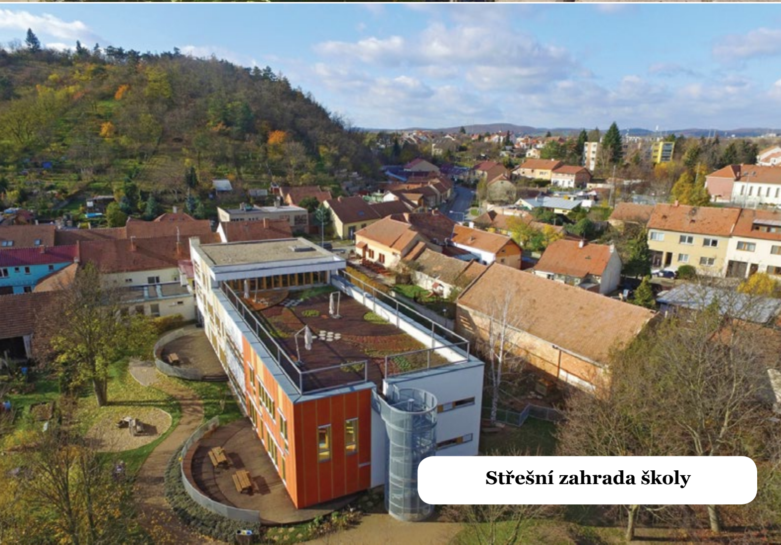
Střešní zahrada školy