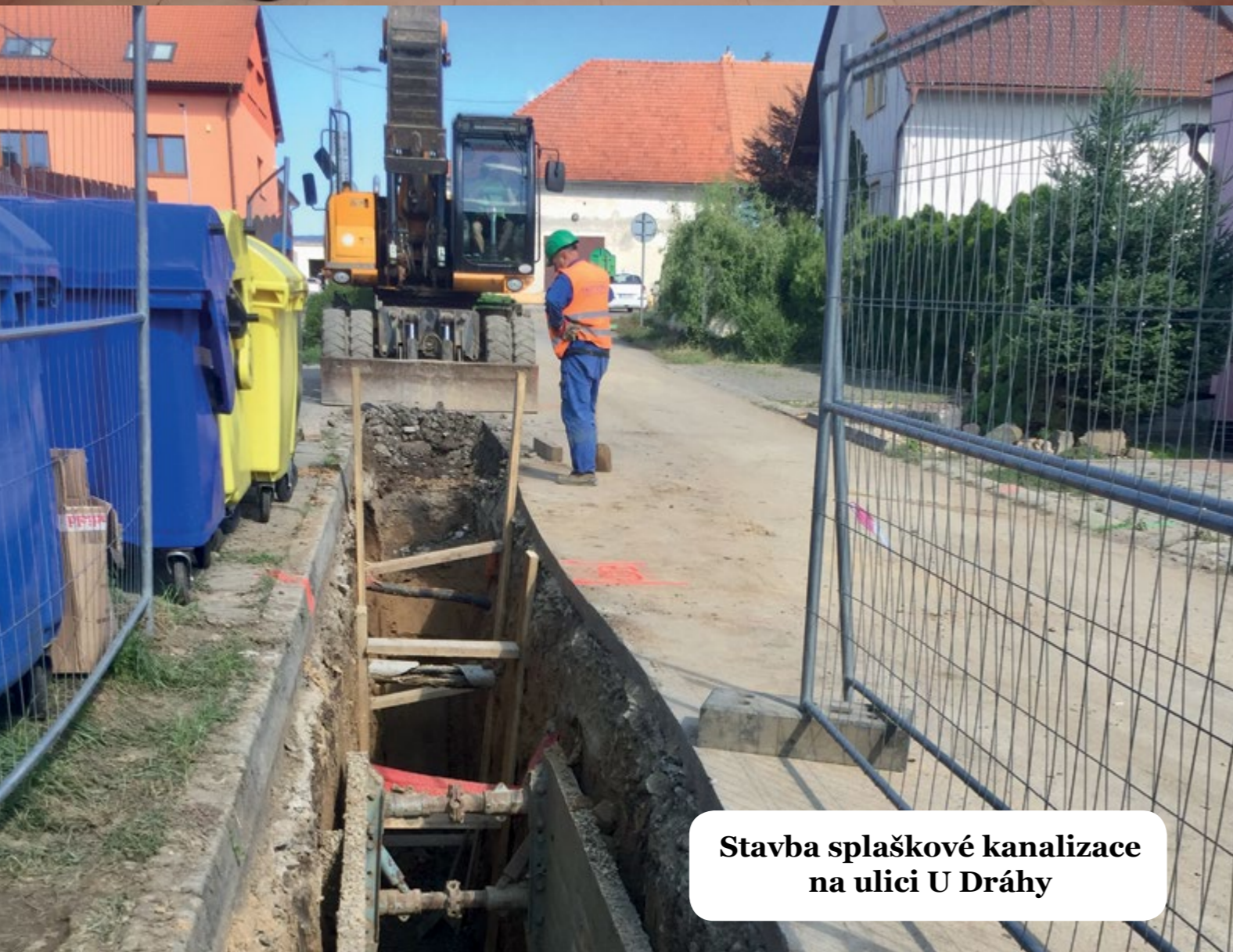
Stavba splaškové kanalizace na ulici U Dráhy