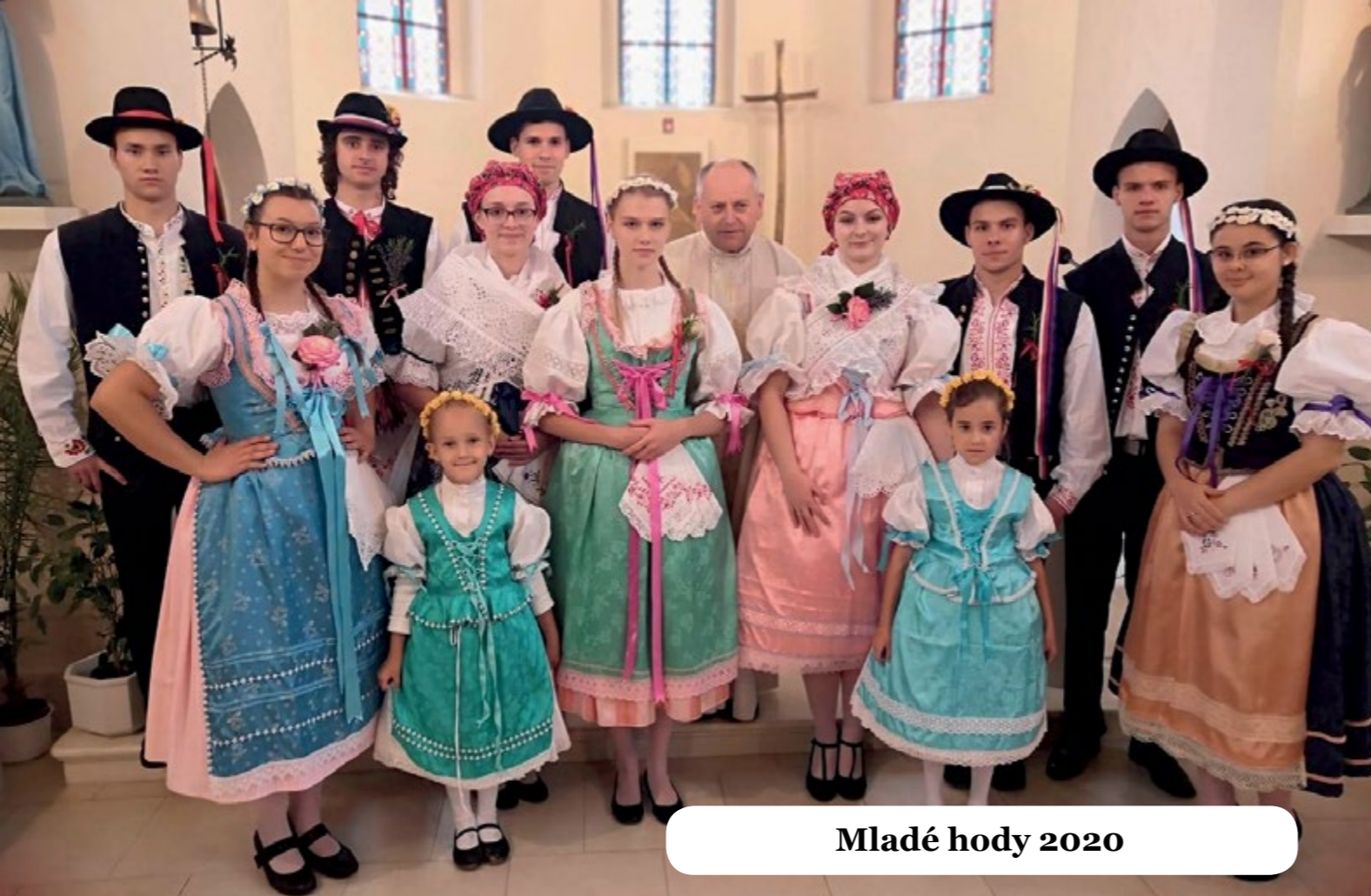
Mladé hody 2020