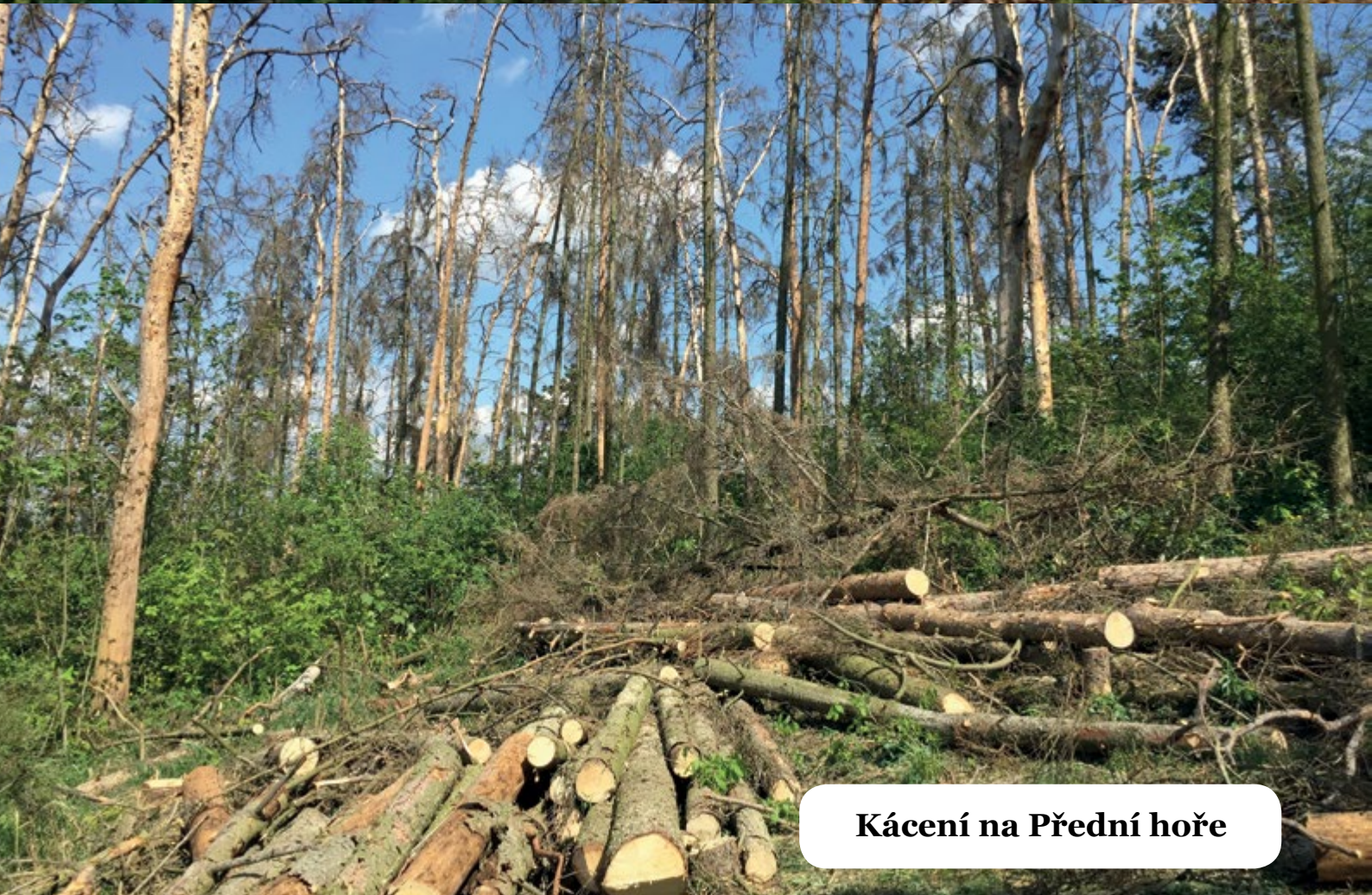
Kácení na Přední hoře