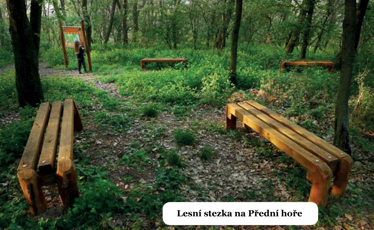
Lesní stezka na Přední hoře