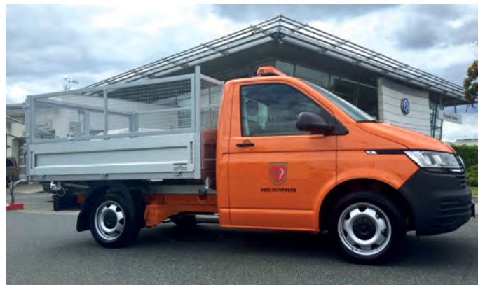
Nový obecní automobil