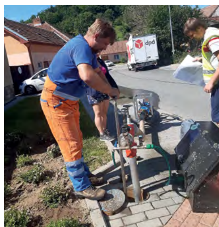
Technik VAS, a. s. vypouští vodu z hydrantu. Přitom měří průtok, tlak a zákal vody.

Důvodem pro napojení obce na další zdroj vody je zlepšení kvality pitné vody (především v koncentraci manganu)