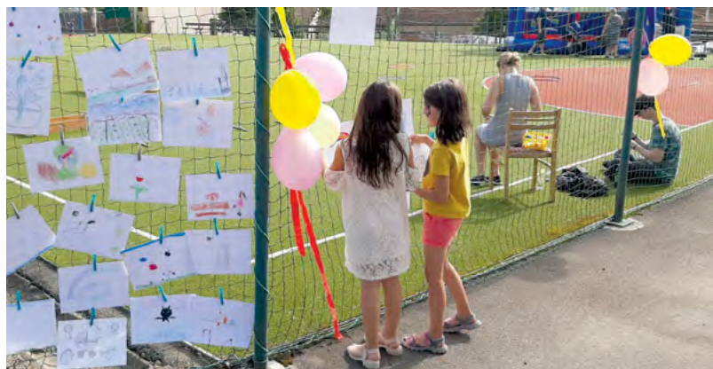
Loučení s létem