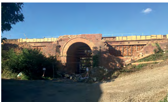
Po elektrizaci trati přibude v obci železniční zastávka. Bohužel ale zase přijdeme o krásný historický most na ulici Družstevní.