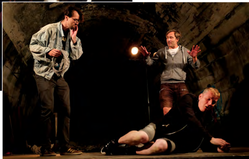
Z improvizace divadla VOSTO5 Stand'artní kabaret