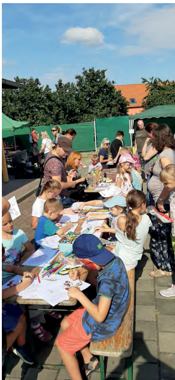
Loučení s létem