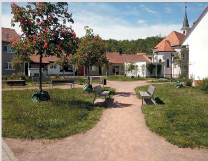
Park U Kaple