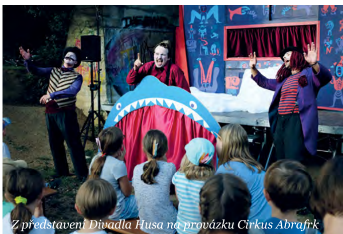
Z představení Divadla Husa na provázku Cirkus Abrafrk

I na podzim je naplánována celá řada akcí, jak se můžete sami přesvědčit v kalendáři uvnitř tohoto zpravodaje. Vzhledem k prudce se horšící situaci s výskytem koronaviru je však otázkou, zda se všechny naplánované akce podaří také uskutečnit.