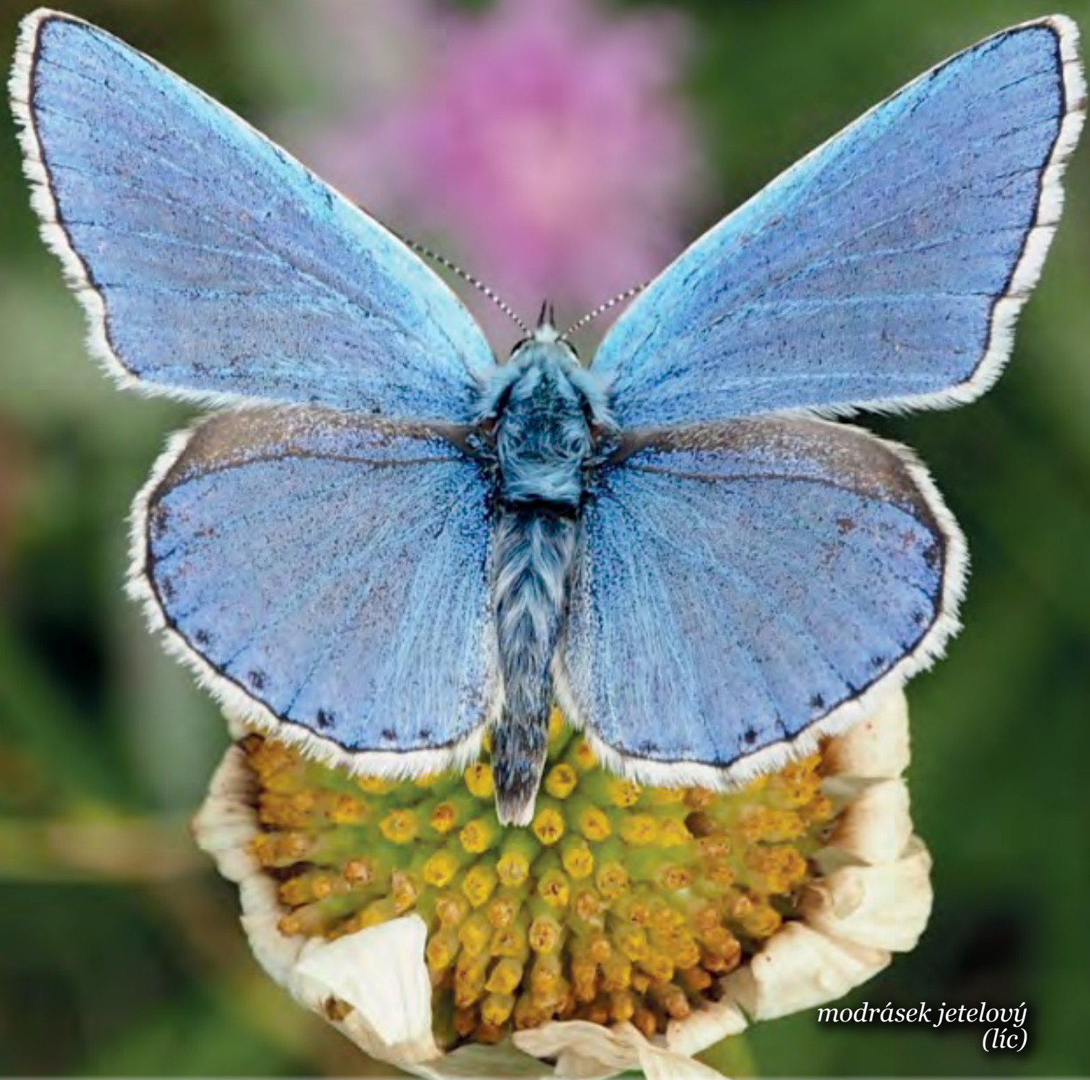
modrásek jetelový (líc)